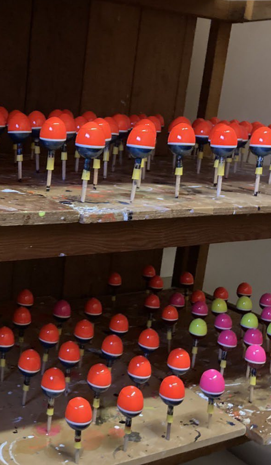
金型製品と違い肉厚があって頑丈です。